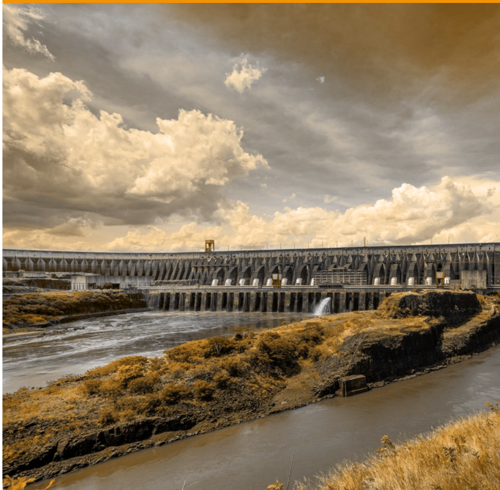
Central Hidroeléctrica de Itaipu.

Más que un Encuentro, el XIX ERIAC será un gran Reencuentro.